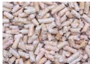
Drei verschiedene Formen des Energieträgers Holz: Scheitholz, Hackschnitzel und Pellets